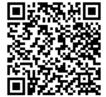
รายละเอียดหลักสูตร